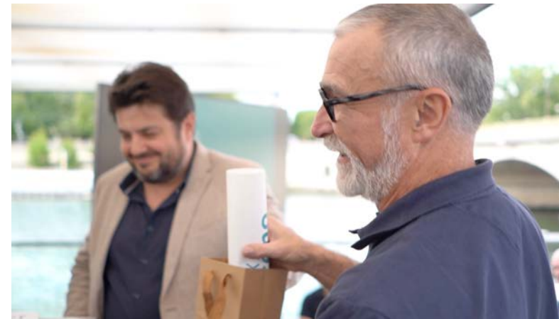
Agence Clémence Farrel – Historique temporaire