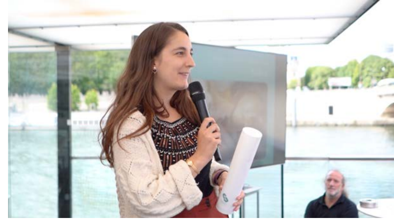
Agence DU&MA - Scientifique temporaire (Betty Lujan)