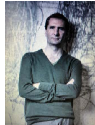
Adrien Gardere Historique permanent